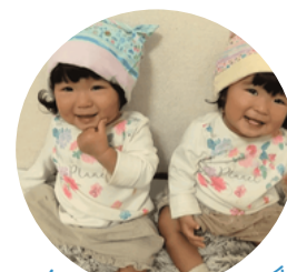
ピンクリボン応援